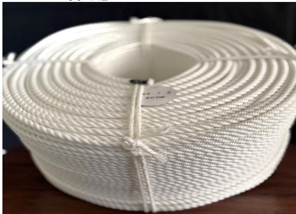
マンセン 96-7.2 コピコート黒染加工品